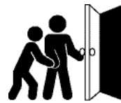
ਬਾਲਗ ਦੇ ਹੱਥ ਦੀ ਵਰਤੋਂ ਦੁਆਰਾ ਲੋੜਾਂ ਦਾ ਪ੍ਰਗਟਾਅ