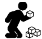
ਸਿਰਜਨਾ ਦੀ ਘਾਟ ਖੇਡ ਦਾ ਵਿਖਾਵਾ