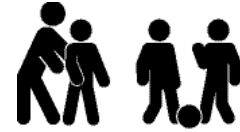
ਕੋਵਲ ਤਾਂ ਹੀ ਸ਼ਾਮਲ ਹੁੰਦਾ ਹੈ, ਜੇਕਰ ਬਾਲਗ ਜ਼ੋਰ ਦੇਣ ਅਤੇ ਮਦਦ ਕਰੇ