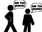
ਇਕੋਲੈਲਿਕ - ਤੋਤੇ ਵਾਂਗ ਨਕਲ ਲਾ ਕੇ ਸ਼ਬਦ ਬੋਲਦਾ