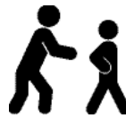
ਅਚੁਚੀ ਦਾ ਪ੍ਰਗਟਾਅ