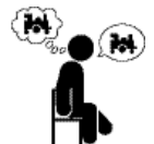
ਇਕੋ ਵਿਸ਼ੇ ਬਾਰੇ ਲਗਾਤਾਰ ਬੋਲਦਾ ਹੈ