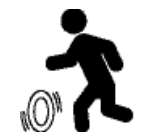
ਚੀਜ਼ਾਂ ਨੂੰ ਫੜਦਾ ਹੈ ਜਾਂ ਵਗਾਰ ਮਾਰਦਾ ਹੈ