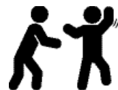
ਹੋਰ ਬੱਚਿਆਂ ਨਾਲ ਨਹੀਂ ਖੇਡਦਾ